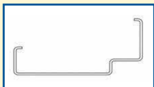
Profil bez těsnění

Profil: 75 mm, 100 mm, 125 mm, 150 mm Umístění pantů: L – levé, P – pravé, Bez značení od rozměru 1 250 mm – oboustranné Rozměry: Z 2045 × 600 Z 2045 × 700 Z 2045 × 800 Z 2045 × 900 Z 2045 × 1100 Z 2045 × 1250 Z 2045 × 1450 Z 2045 × 1600